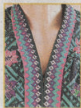
马航制服的传统花纹，既有代表国家的木槿花，也有砂拉越传统编织图案。