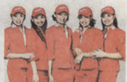
亚洲航空鲜红的制服，显得青春充满活力。