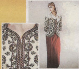
皇家汶莱航空的制服也类似卡峇雅，只是加了头巾，胸口以拉链取代传统的纽扣，是改良的卡峇雅。