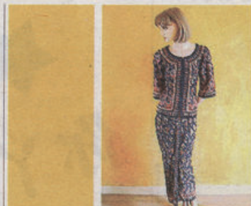
与马航相似的新航制服，同样采用传统的峇迪印花布料。