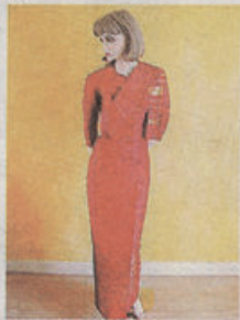
泰国航空强调民族特色。