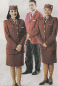
阿联酋航空把回教特色放到头部，身上是西式紫色套装。